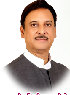
मा.आ. श्री. दिलीपरावजी देशमुख माजी क्रिडा व युवक कल्याणमंत्री महाराष्ट्र राज्य