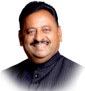
मा.आ. बाबासाहेब पाटील अहमदपूर-चाकुर विधानसभा मतदारसंघ