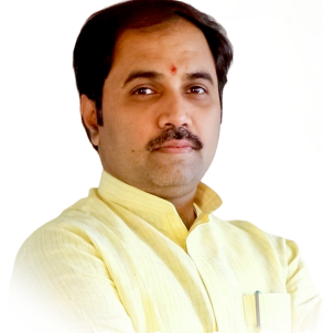
मा.आ. संभाजी पाटील निलंगेकर माजी कॅबिनेट मंत्री, महाराष्ट्र राज्य