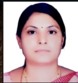
अॅड. गवारे आदिमाया उदय संचालिका