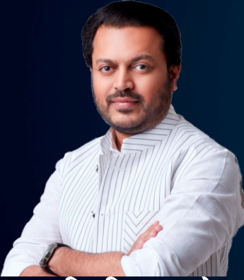
मा.आ. अमित विलासराव देशमुख माजी वैद्यकीय शिक्षण मंत्री, महाराष्ट्र राज्य