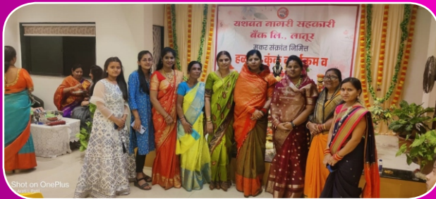
बँकेचे महिला ग्राहक सभासद व हितचिंतक यांच्यासाठी आयोजित भव्य हळदी कुंकूवाचा कार्यक्रम