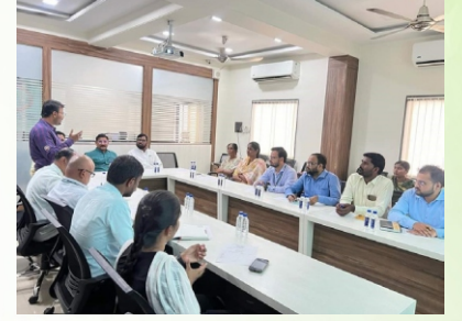
बँकेतील कर्मचाऱ्यां करिता आयोजित केलेल्या प्रशिक्षण वर्ग प्रसंगी