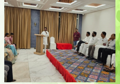
आर्थिक वर्ष २०२३-२४ मध्ये बँकेने साध्य केलेल्या प्रगती बद्दल बँकेच्या संचालक व कर्मचारी यांचा पुणगौरव सोहळ्यातील क्षण