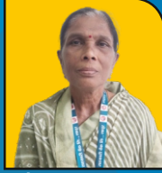
श्रीमती जगताप एम.ए. सि. ऑफिसर