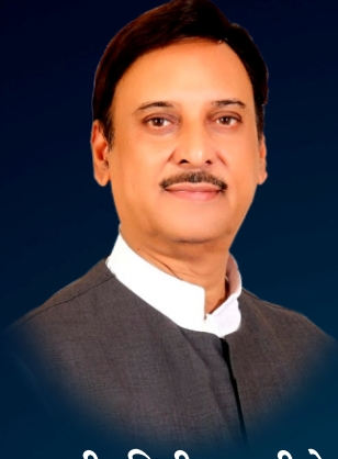
मा.आ. श्री. दिलीपरावजी देशमुख माजी क्रिडा व युवक कल्याणमंत्री महाराष्ट्र राज्य