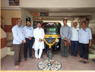
कर्ज वाटप योजनेचा शुभारंभ करताना मा. चेअरमन, सभासद व कर्मचारी