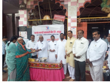
आषाढी एकादशी निमित्त बँके तर्फे फळाचे वाटप करताना बँकेचे चेअरमन, व्हाईस चेअरमन, संचालक व कर्मचारी वृंद